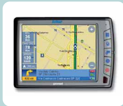
Navigatore GPS Geosat 5