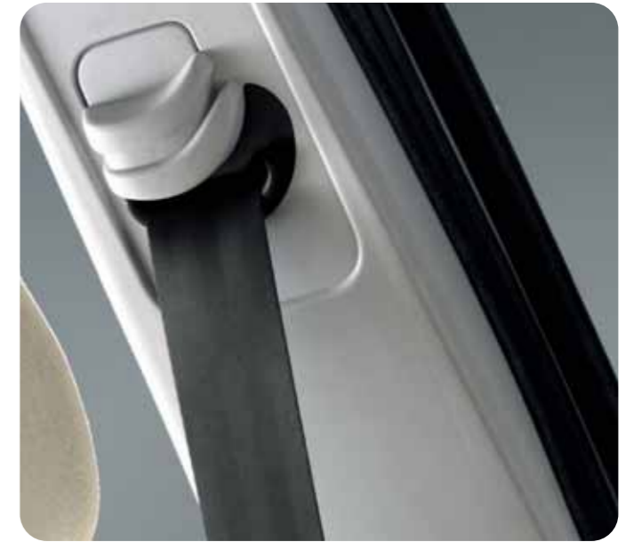
Gamma XAD: cinture di sicurezza a tre punti regolabili in altezza e a pretensione pirotecnica.