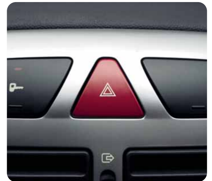
207 XAD e 307 XAD: accensione automatica delle luci di emergenza in caso di frenata o forte decelerazione.