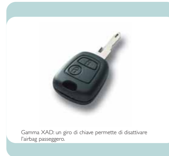
Gamma XAD: un giro di chiave permette di disattivare l'airbag passeggero.