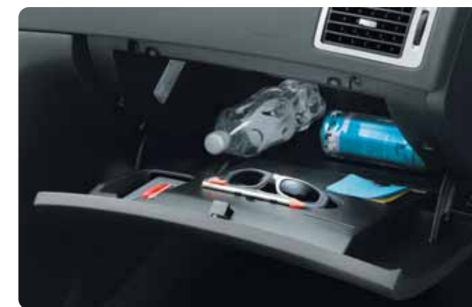
Cassetto portaoggetti refrigerato (se presente clima manuale)

(1) Con il caricatore CD e la Radio Mono CD-RD4, il display C- compatibile MP3, diventa di serie