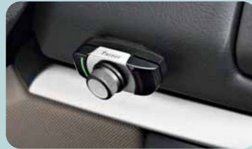
Kit Bluetooth Parrot