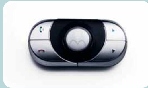
Kit Bluetooth Motorola