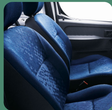
Sedili robusti e confortevoli