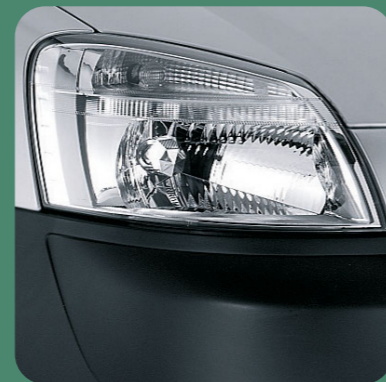
Fari anteriori con vetro liscio