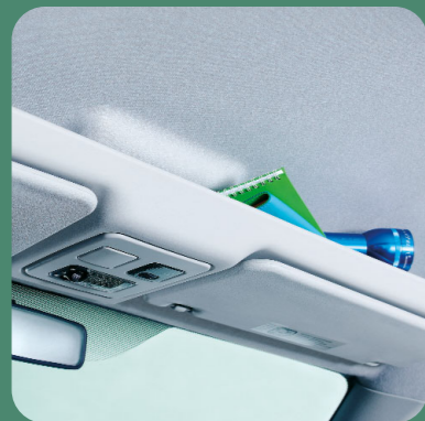
Vano portaoggetti sotto il padiglione anteriore