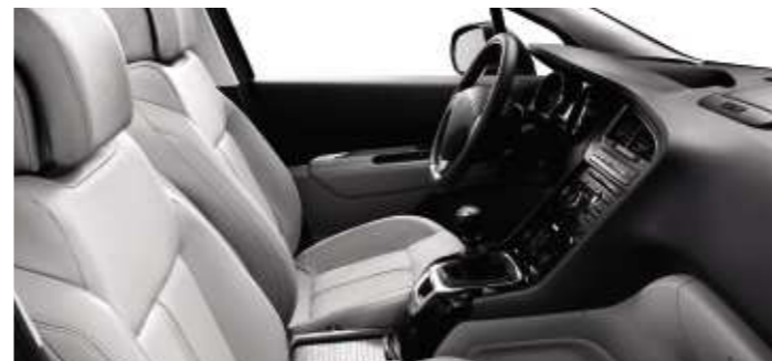
Pelle Guérande* (Opzione su Féline)