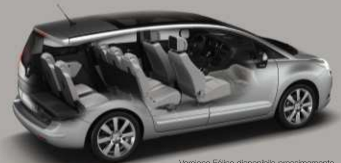
Versione Féline disponibile prossimamente. Gli equipaggiamenti presentati nelle immagini possono essere di serie o in opzione.

**Non disponibile, di serie o in opzione secondo le versioni.