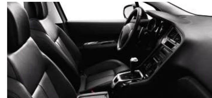
Pelle Tramontane* (Opzione su Féline)