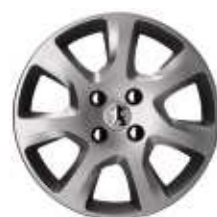
Copriruota 16" HAUMEA (Di serie su Premium)