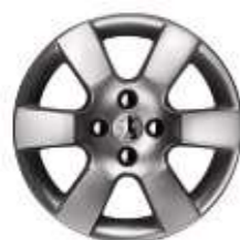
Cerchi in lega da 16" ERISS (Di serie su Tecno e in opzione su Premium)