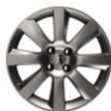
Cerchi in lega da 18" MAGNETIK (Opzione su Féline)

*Dettaglio sedili anteriori in pelle – Appoggiatesta: Parte anteriore in pelle. – Schienali: Parte anteriore e lati interni delle estensioni laterali in pelle. – Sedute: Parte superiore e lati interni delle estensioni laterali in pelle. – Appoggiatesta: Parte anteriore in pelle.