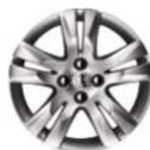
Cerchi in lega da 17" QUARK (Di serie su Féline e in opzione su Tecno)