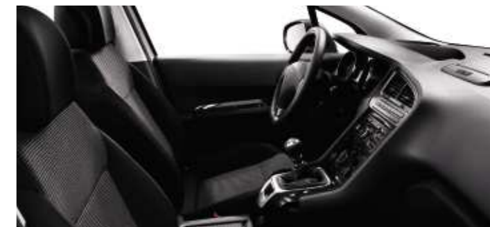
Tessuto Strada Tramontane (Tecno/Féline)