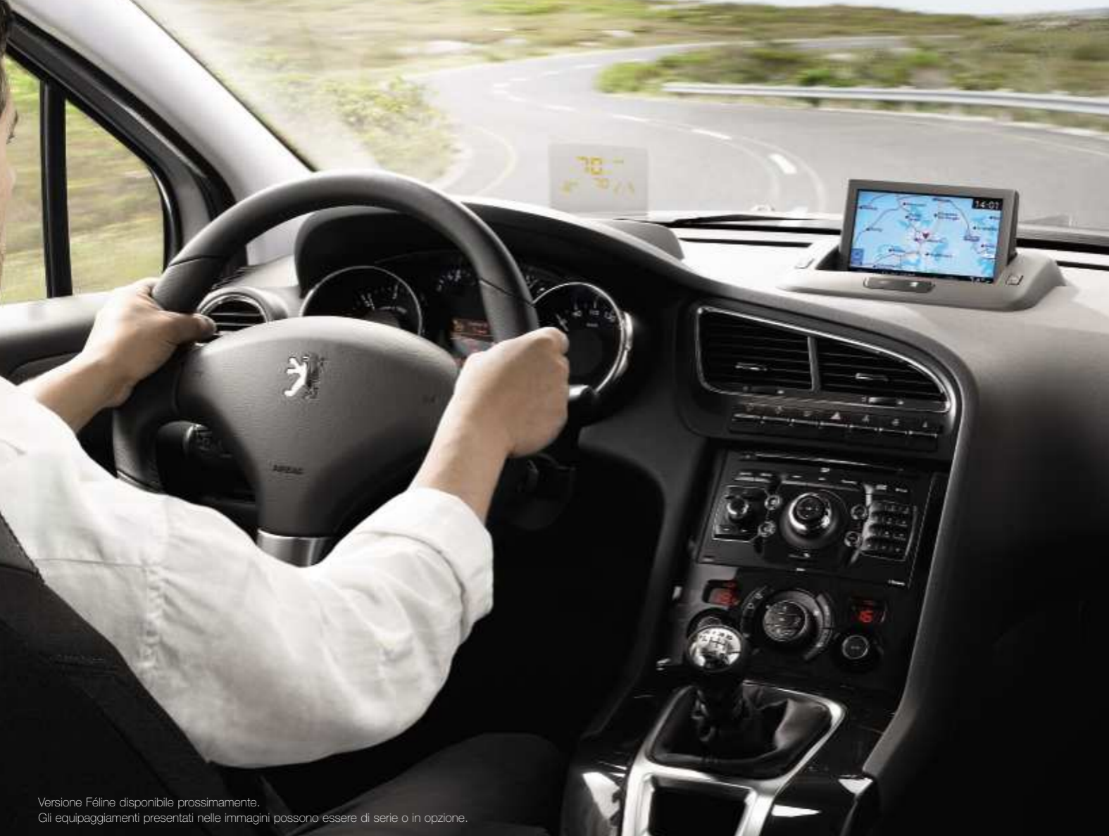
Versione Féline disponibile prossimamente. Gli equipaggiamenti presentati nelle immagini possono essere di serie o in opzione.