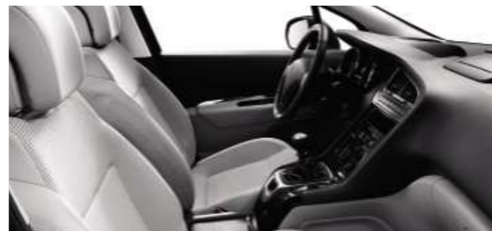
Tessuto Strada Guérande (Tecno/Féline)