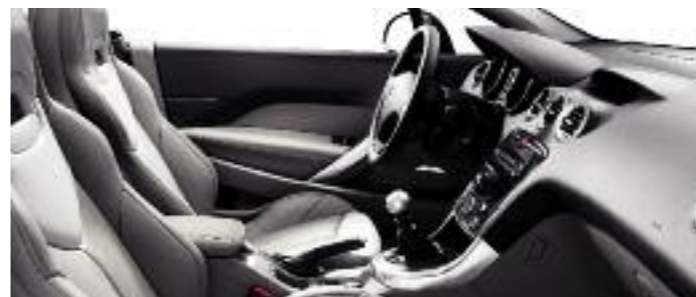
Pelle Claudia Bicolore Grège/Lama*