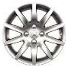
Cerchi in lega IZALCO 16* (Di serie su Tecno)