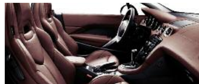
Pelle Integrale Claudia traforata Vintage*