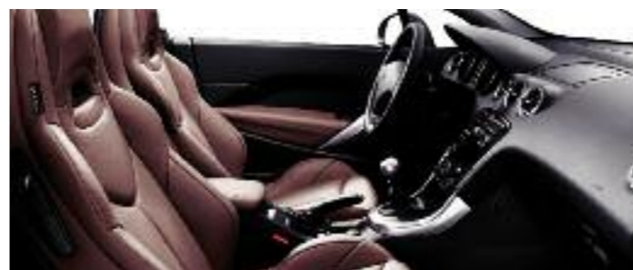
Pelle Claudia traforata Vintage*