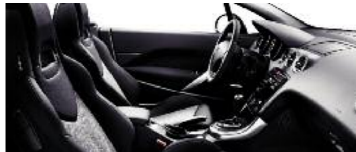
Tessuto Speed'Up Nero/Grigio Di serie su Tecno e Féline