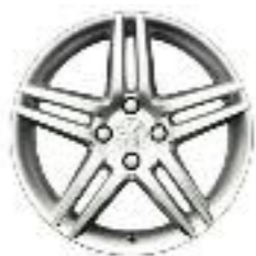
Cerchi in lega STROMBOLI 17* (Di serie su Féline e in opzione su Tecno)