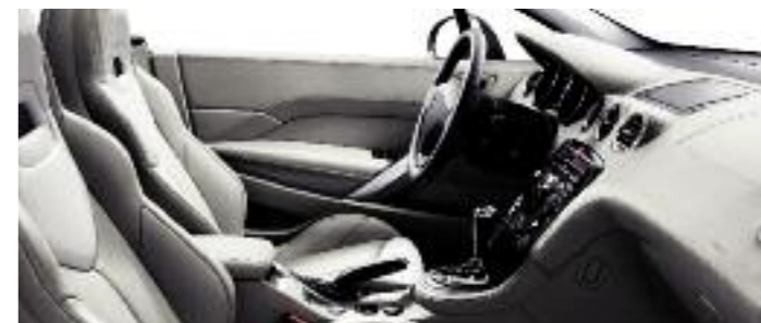
Pelle Integrale Claudia bicolore Grège/Lama*