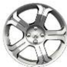
Cerchi in lega LICANCABUR 18* (In opzione su Féline)