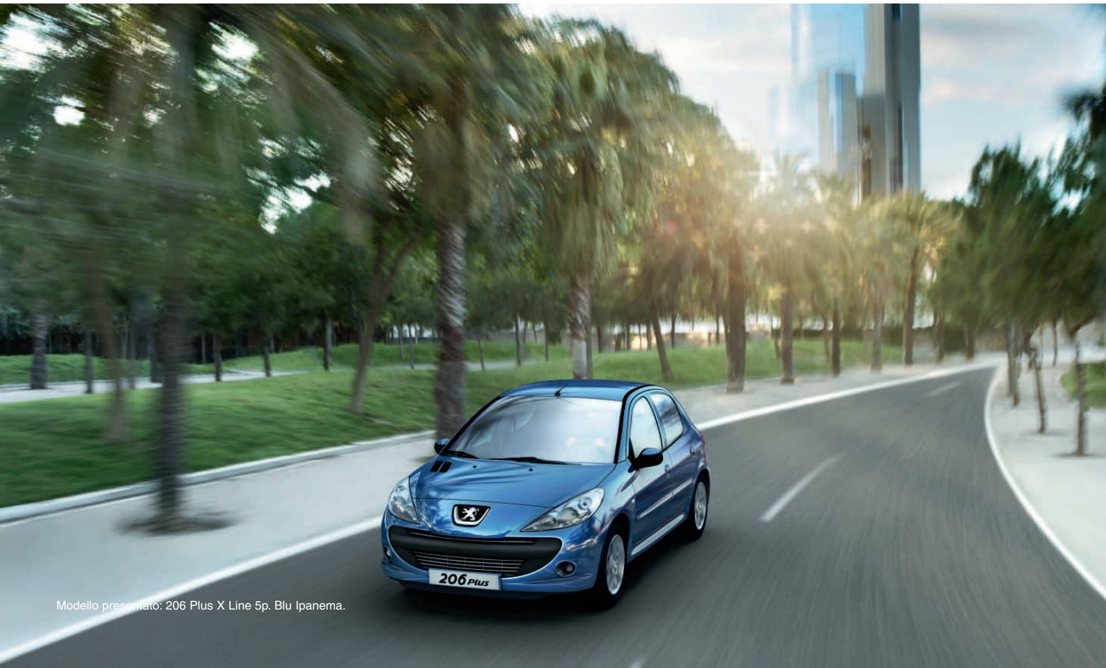
Modello presentato: 206 Plus X Line 5p. Blu Ipanema.

• Tutte le vetture del Marchio sono prodotte in stabilimenti certificati ISO 14001 e sono progettate in modo da essere riciclate al 95% alla fine del ciclo di vita.