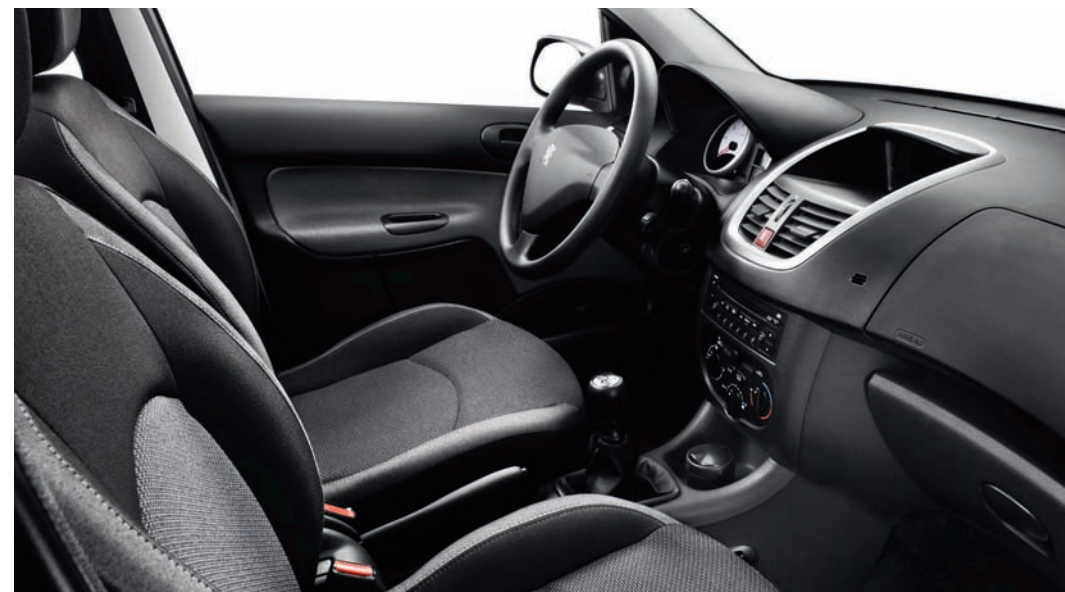
Tessuto Pacifico Nero/Blu (WIP Sound in opzione)