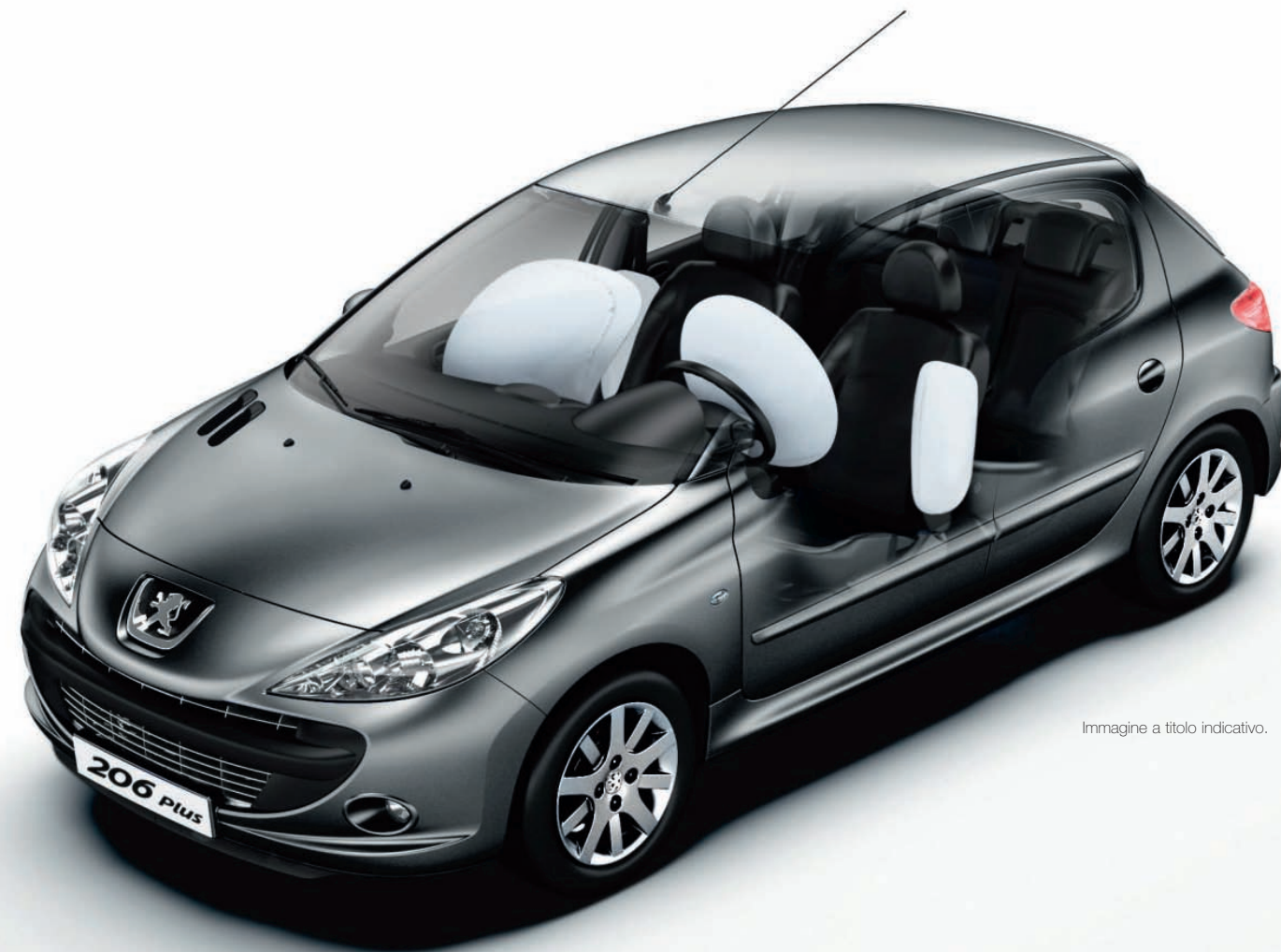
Immagine a titolo indicativo.

* Disponibile in opzione a seconda delle versioni nella seconda metà del 2009.