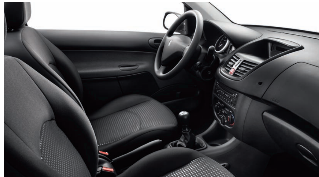
Tessuto Chekmate Nero (WIP Sound in opzione)