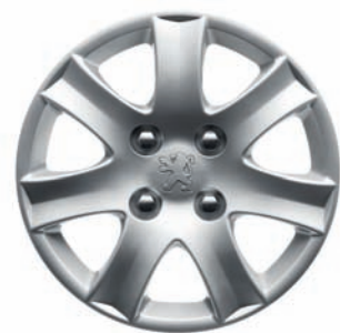
Copricerchi "Spa" da 14"